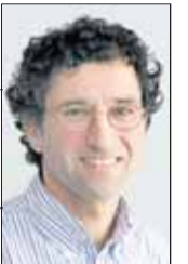
Von Oliver Stade

Der Harz als „magische Gebirgswelt“, so neu ist das nicht. Das Design, mit dem der Harzer Tourismusverband (HTV) künftig für die Region werben will, mag der eine gut finden, der andere nicht. Weil ohnehin die Millionen fehlen, um eine Werbeidee in den Köpfen der Urlauber nachhaltig zu verankern, hat der neue Auftritt nur eine Chance, wenn er in vielen Broschüren, Heften und anderen Werbemitteln auftaucht. Nicht nur der HTV, auch ande-